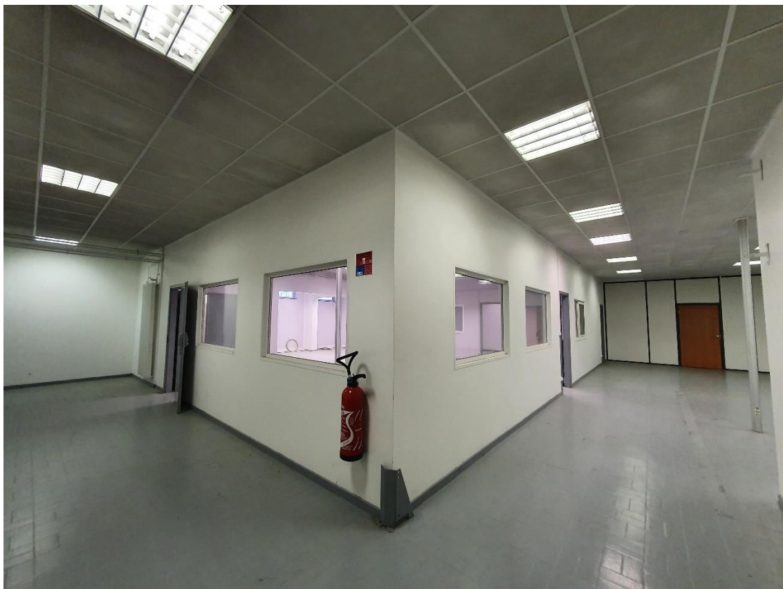
Figure 6: Lot 5 / Espace de stockage basse hauteur ou bureaux à aménager