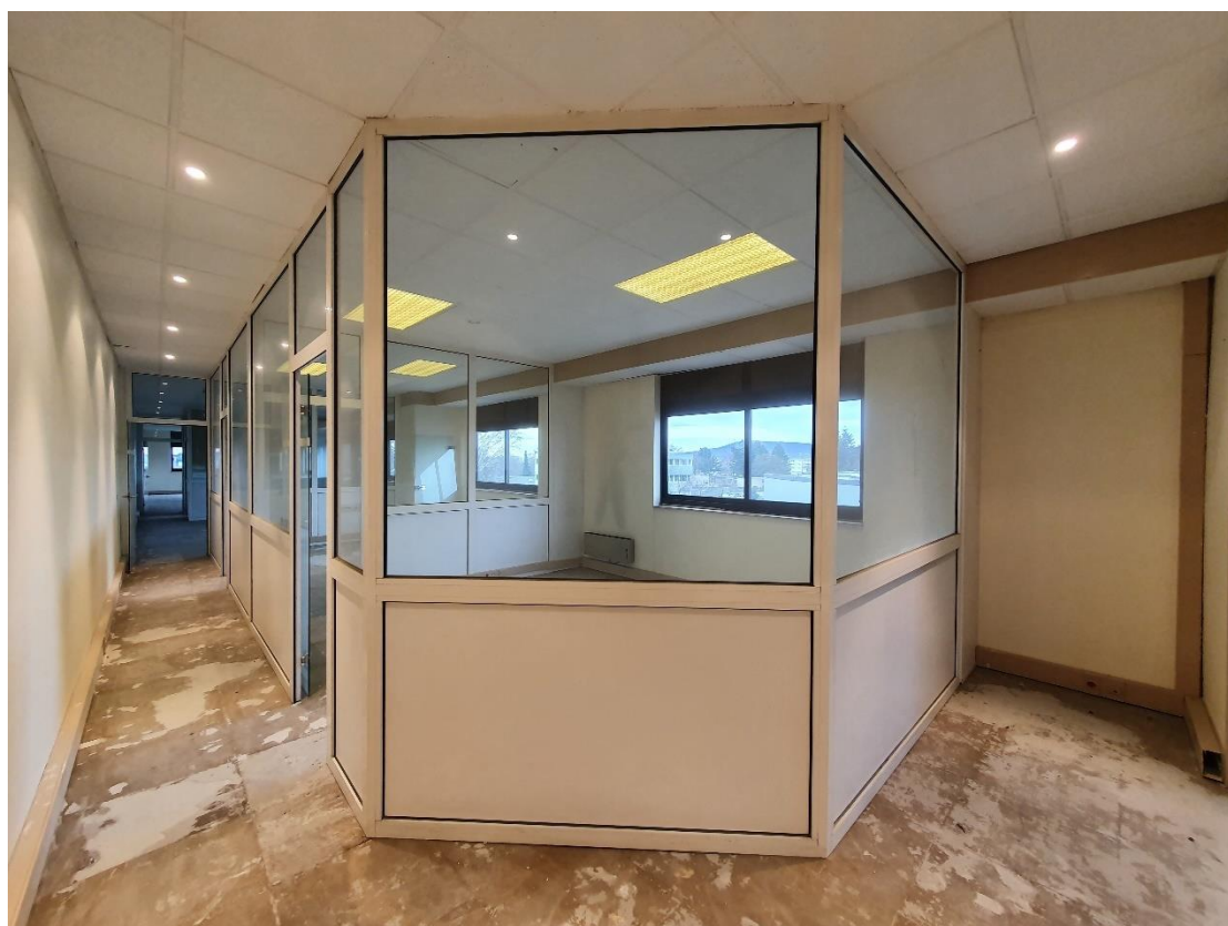
Figure 10: Lot 7 / Bureaux et sanitaires à aménager