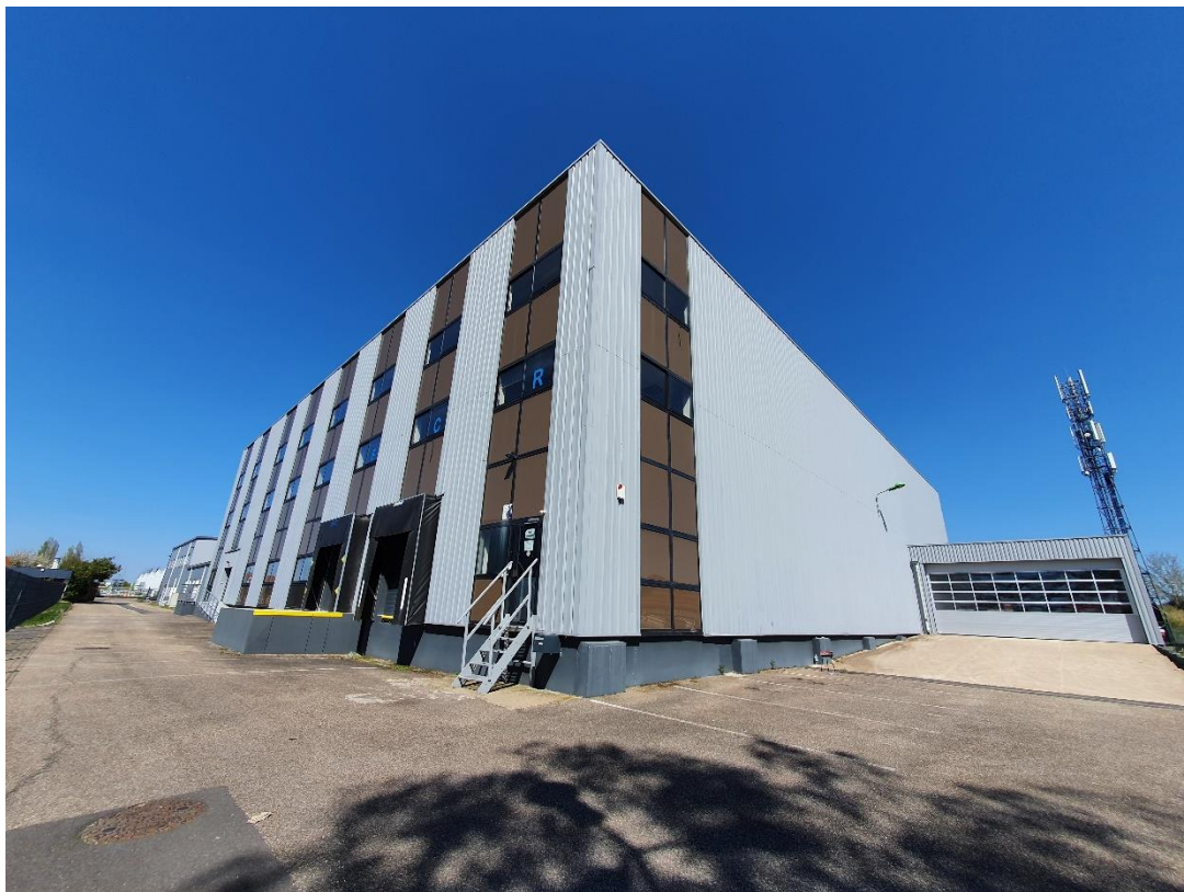
Figure 11: Lot 8 / Accès bureaux et dépôt avec rampe