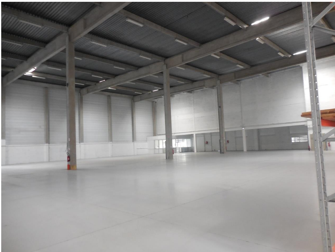
Figure 13: Lot 8 / intérieur du dépôt avec 10-12m de hauteur libre