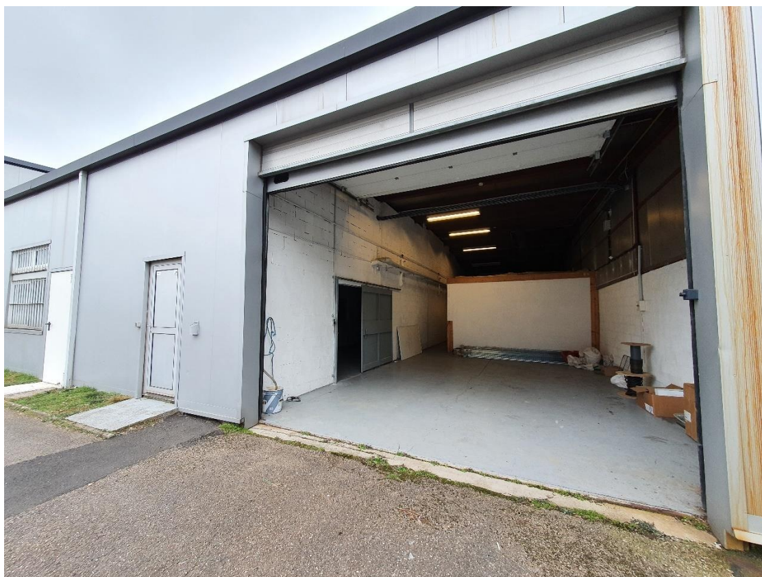
Figure 4: Lot 6 / Face OUEST / Accès piéton et porte sectionnelle automatique