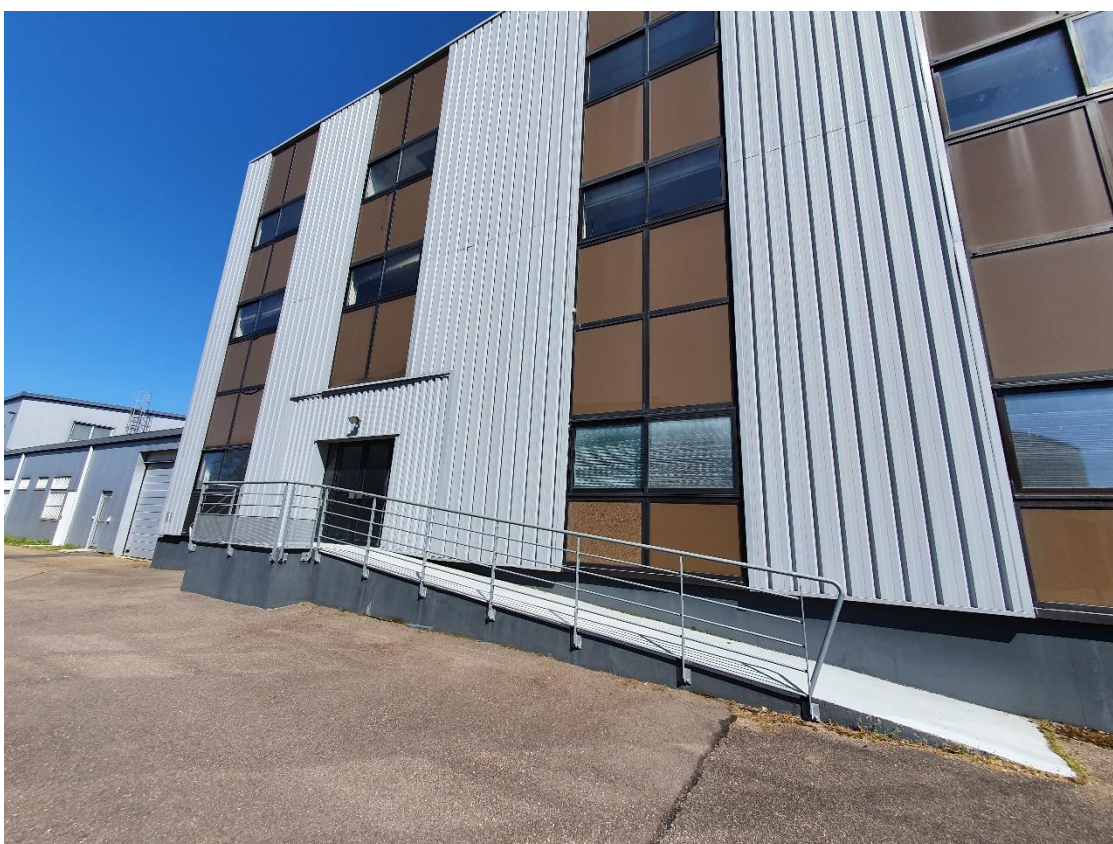
Figure 8: Lot 7 / Face OUEST / Accès piéton et rampe PMR