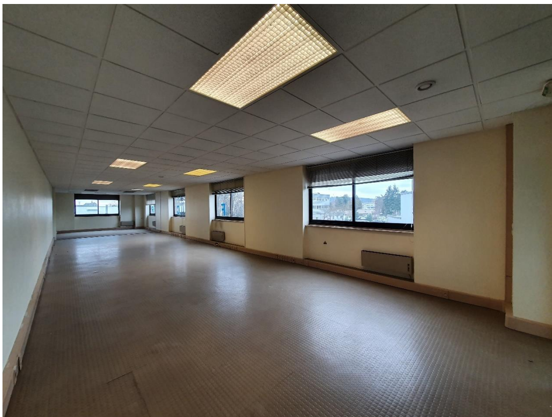
Figure 9: Lot 7 / Bureaux et sanitaires à aménager