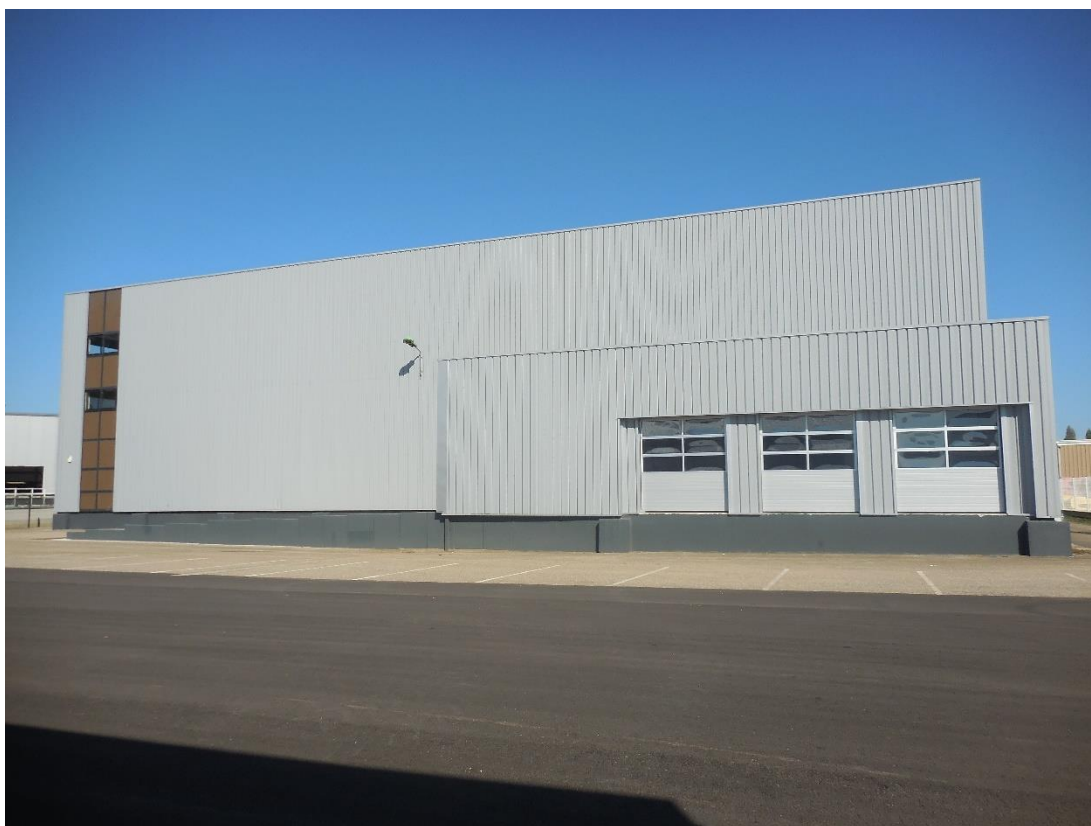
Figure 12: Lot 8 / Accès bureaux et dépôt avec rampe