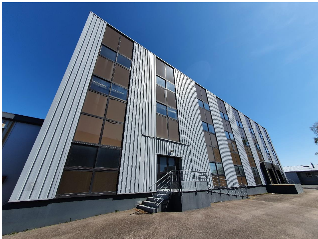
Figure 7: Lot 7 / Face OUEST / Accès piéton et rampe PMR