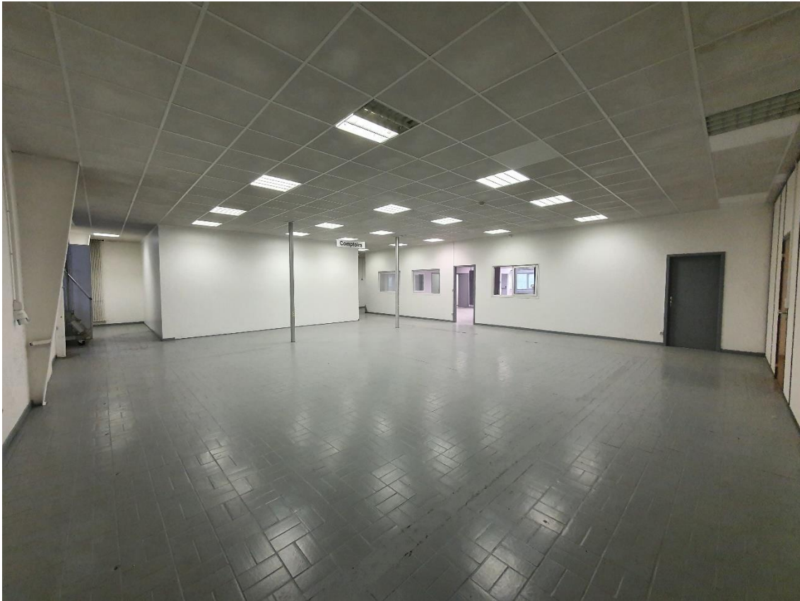
Figure 5: Lot 5 / Espace de stockage basse hauteur ou bureaux à aménager