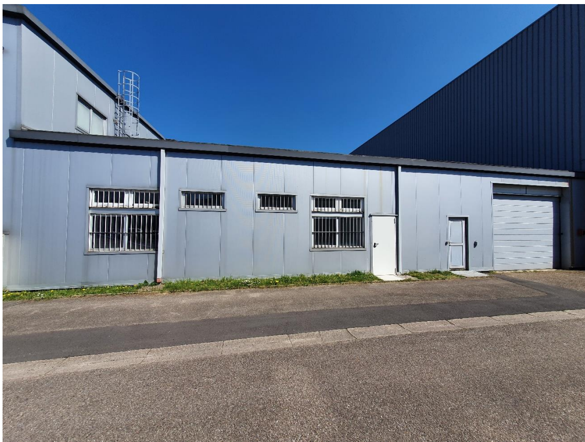
Figure 3: Lots 5 et 6 / Face OUEST / Accès piéton et porte sectionnelle automatique